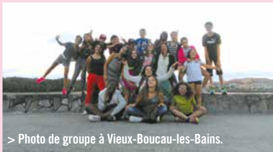
> Photo de groupe à Vieux-Boucau-les-Bains.