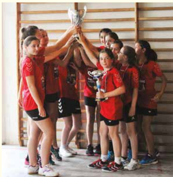
1 er titre départemental pour Rieux Handball.