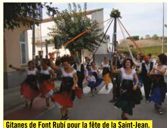
Gitanes de Font Rubí pour la fête de la Saint-Jean.

12 h : Apéritif d'honneur et repas en commun de la délégation catalane au préau avec les familles d'accueil, 17 h 30 : Préparation des groupes folkloriques de Font Rubí devant la cathédrale (Les Gitanes, les Cercollats, les Pastorets, les Capgrossos et les Bastoners), 18 h : Départ du défilé devant la mairie, trajet rue de l'Évêché, la halle, rue Labastide pour arriver au préau devant le kiosque, 20 h : Apéritif animé par une banda et repas ouvert aux Rivois et Rivoises, servi par le traiteur de renommée « Calbet » avec au menu : salade paysanne, civet de cuisse de canard, gratin ariégeois, bethmale et sa