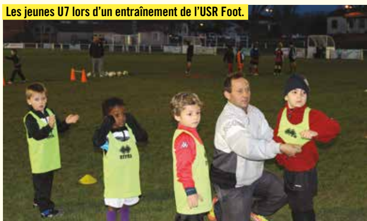
Les jeunes U7 lors d'un entraînement de l'USR Foot.