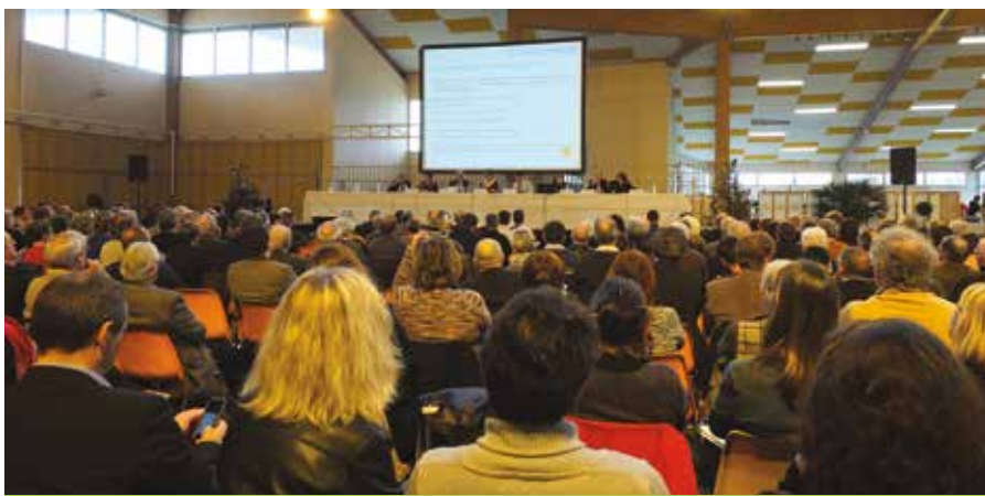
L'Agence technique départementale (ATD) a tenu le 2 mars sa dernière AG du mandat à la salle polyvalente sous la présidence de Pierre Izard, président du Conseil départemental.

1 er samedi et 3 e samedi du mois (6 juin, 20 juin, 4 juillet, 18 juillet), 9h à 12h. Mairie de Cintegabelle, 05 34 33 32 80