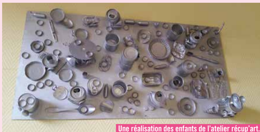
Une réalisation des enfants de l'atelier récup'art.