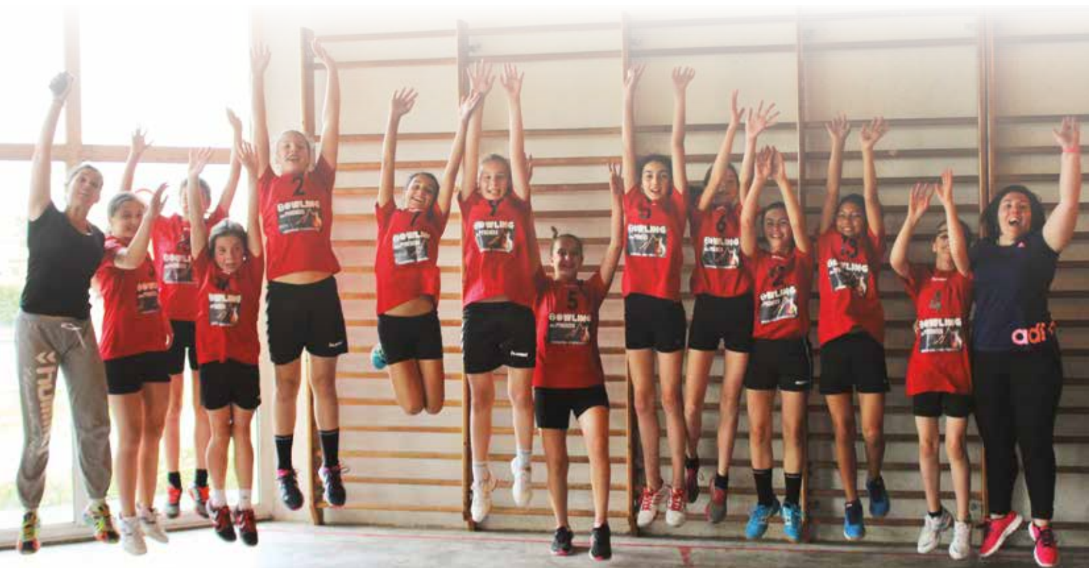
Rieux Handball : catégorie filles moins de 13 ans, championnes départementales.