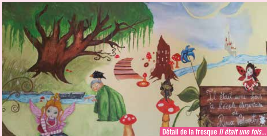
Détail de la fresque Il était une fois...

« Durant cette première année, j'ai voulu donner aux enfants quelques notions sur l'histoire de la peinture, leur proposer différents supports et méthodes, les laisser expérimenter. J'ai essayé de leur transmettre le plaisir de dessiner, de peindre. Ils ont trouvé les murs tristes alors, ensemble, nous nous sommes lancés dans la réalisation d'une fresque. Les enfants ont laissé libre cours à leur imagination pour proposer un monde magique et coloré. »