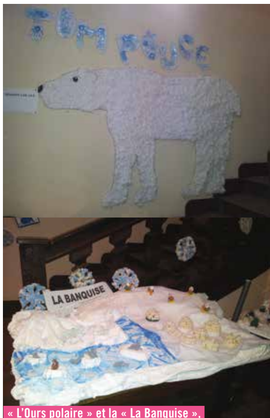
« L'Ours polaire » et la « La Banquise », réalisés par les 5/7 ans