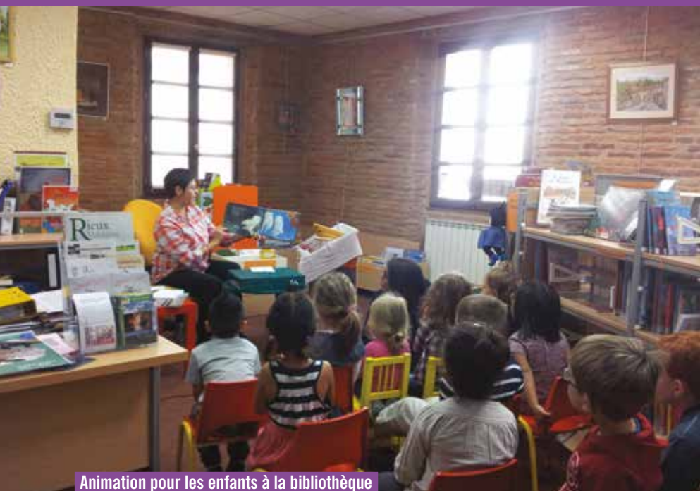
Animation pour les enfants à la bibliothèque