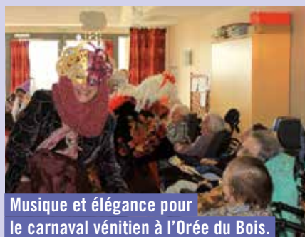
Musique et élégance pour le carnaval vénitien à l'Orée du Bois.

fêtes de Rieux, un carnaval 2015 riche en couleurs et costumes de Venise.