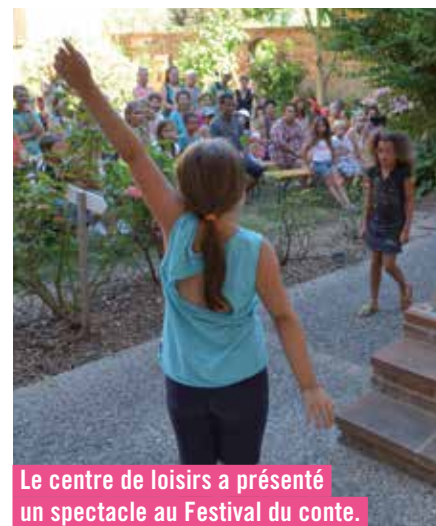
Le centre de loisirs a présenté un spectacle au Festival du conte.

Un mini-camp itinérant et sportif a eu lieu durant lequel les enfants du groupe des 8-11 ans ont pu s'impliquer activement dans la réalisation de leur aventure : préparation du convoi pour les déplacements à vélo, confection des menus, achats et réalisation des repas, installation et rangement des camps... et découverte de différentes activités ludiques et sportives : wakeboard, moto et canoë.