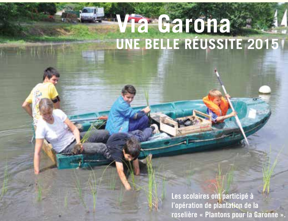
Les scolaires ont participé à l'opération de plantation de la roselière « Plantons pour la Garonne ».

Même si l'orage du samedi soir a rafraîchi les esprits, la fête du plan d'eau de Mancies entre Rieux-Volvestre, Carbonne et Salles-sur-Garonne s'est déroulée dans une convivialité estivale.