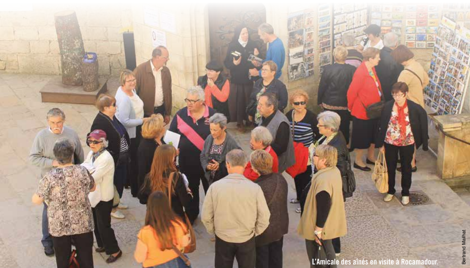
L'Amicale des aînés en visite à Rocamadour.