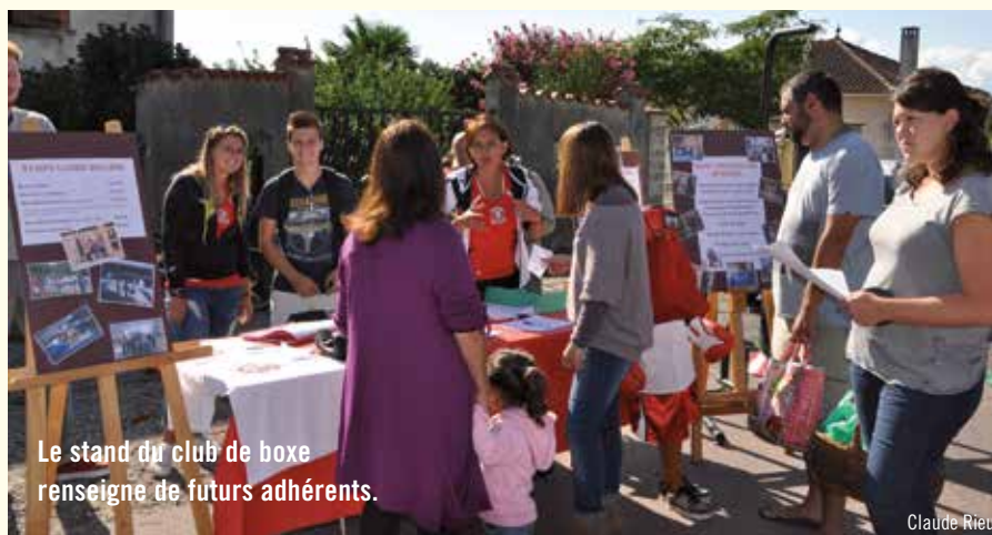
Le stand du club de boxe renseigne de futurs adhérents.