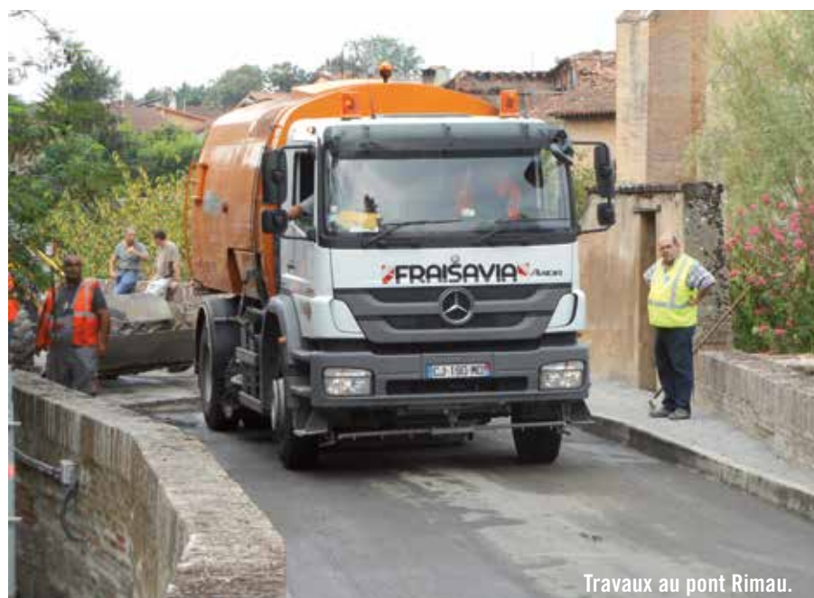
Travaux au pont Rimau.

de la Haute-Garonne pour un montant de plus de 125 000 € TTC.