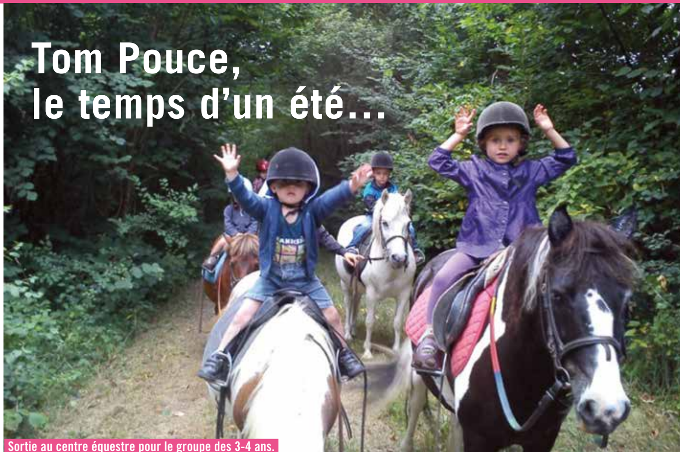
Sortie au centre équestre pour le groupe des 3-4 ans.