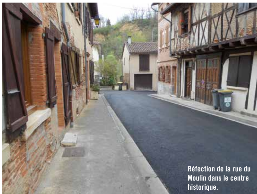
Réfection de la rue du Moulin dans le centre historique.