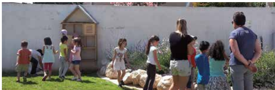
L'atelier nature : mise en place de la maison des insectes au parc des Écureuils.

ture, musique, théâtre, poterie, céramique, tennis, dessin, arts plastiques, citoyenneté, sensibilisation aux handicaps, jardinage, expériences scientifiques, hockey ou encore danse. Tandis que les enfants de l'école maternelle sont sensibilisés à la lecture, aux jeux collectifs et sportifs, aux jeux de société et à la relaxation.