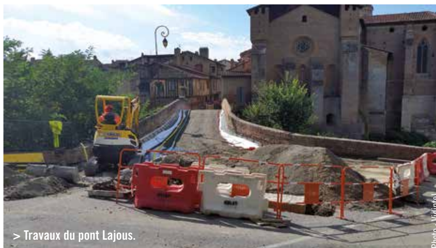
> Travaux du pont Lajous.

Si des nuisances peuvent perturber le quotidien pendant ce programme, ces travaux d'étanchéité sont cependant nécessaires à la sécurité de l'ouvrage et au maintien de la circulation sur le pont. En outre, cette cure de jeunesse participe à l'embellissement du cœur historique de notre ville-cité.