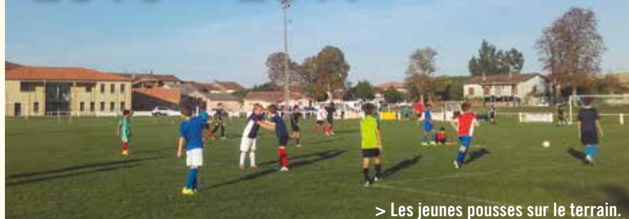
> Les jeunes pousses sur le terrain.

Cette association, loi 1901, est gérée par des bénévoles, avec le soutien de la municipalité, du département, des sponsors, sans oublier les parents des jeunes pousses.