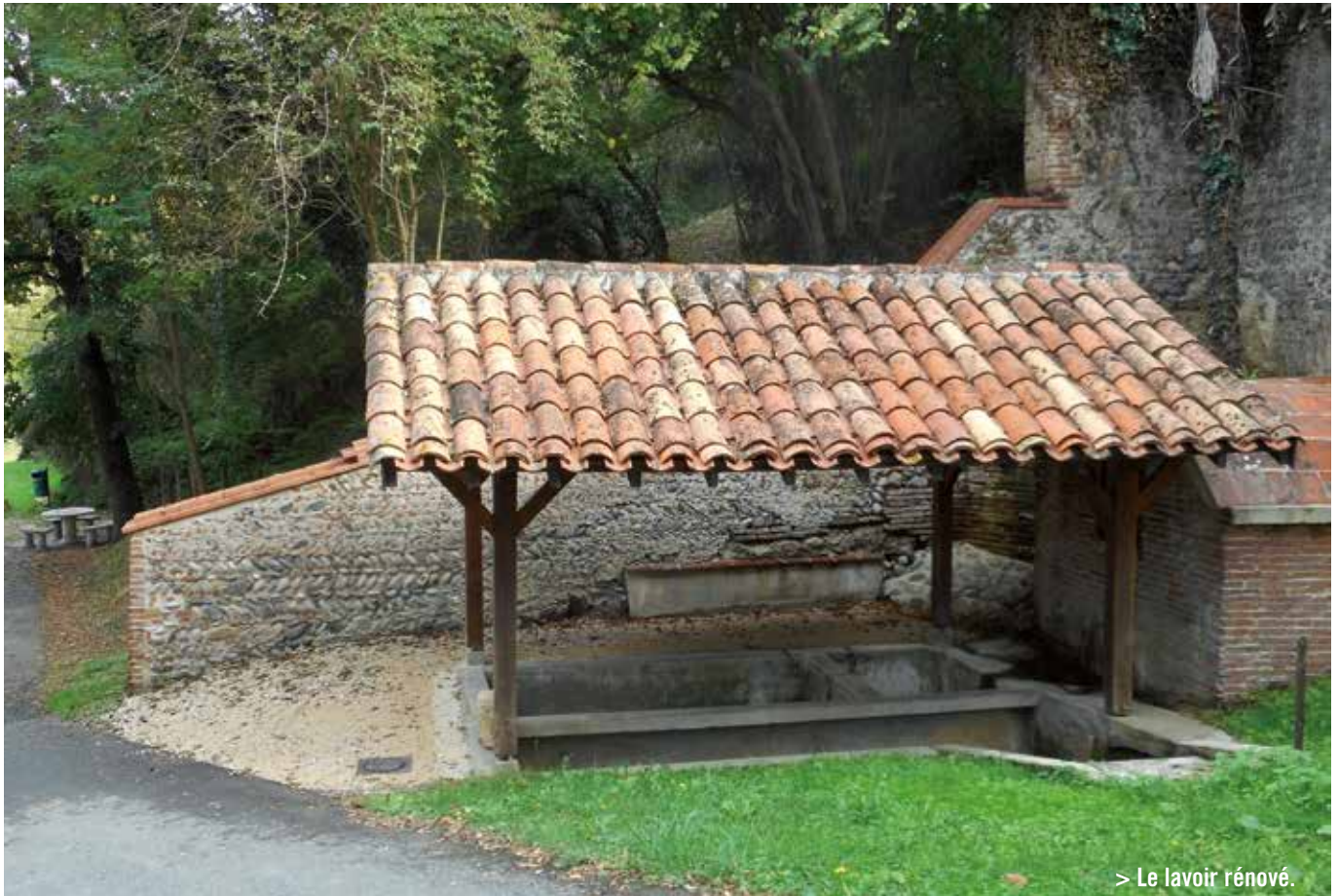
> Le lavoir rénové.