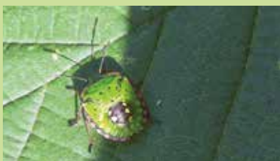
Larve au dernier stade de la punaise verte.