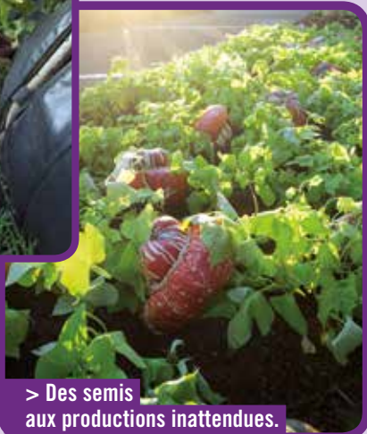
> Des semis aux productions inattendues.