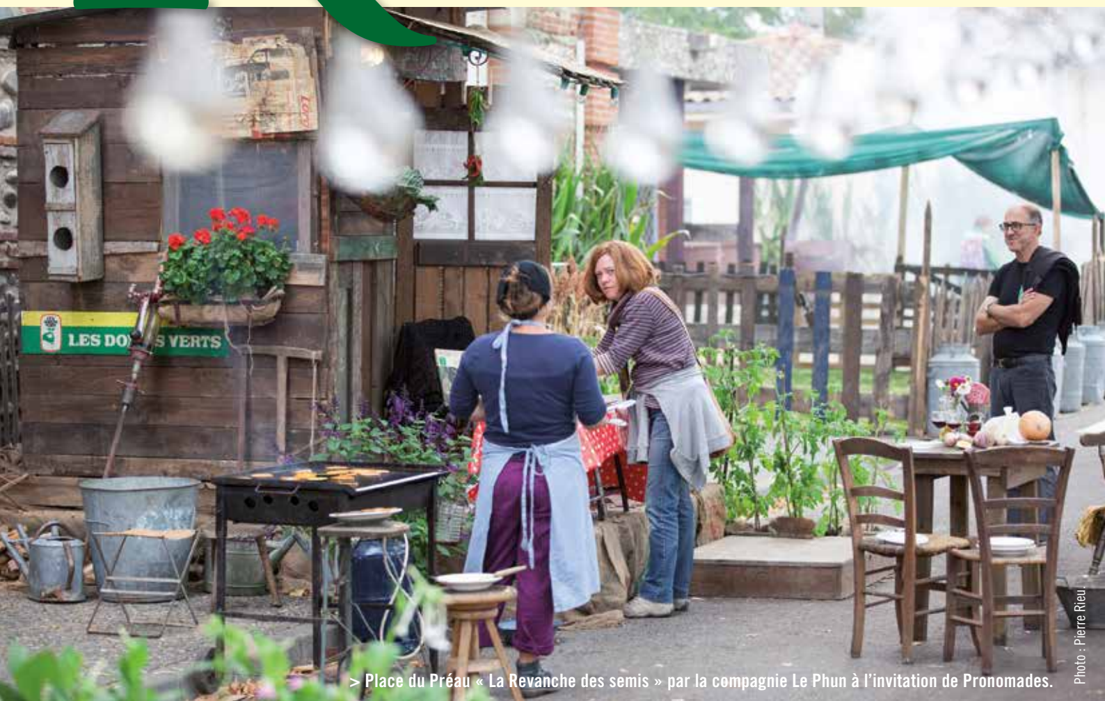
> Place du Préau « La Revanche des semis » par la compagnie Le Phun à l'invitation de Pronomades.