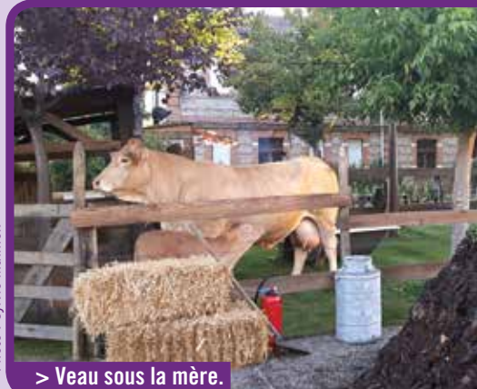
> Veau sous la mère.