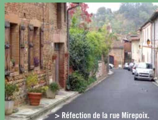
> Réfection de la rue Mirepoix.