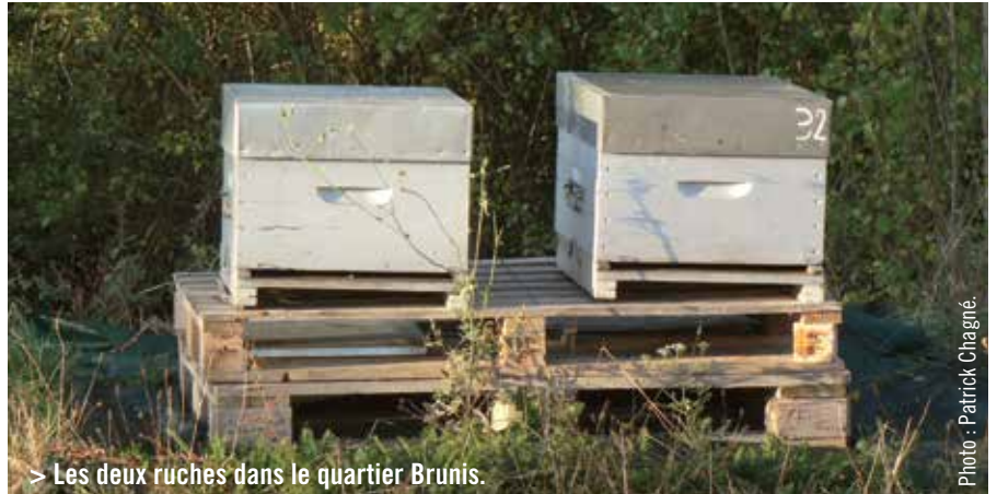
> Les deux ruches dans le quartier Brunis.