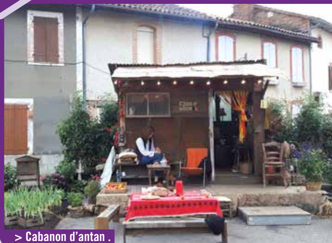
> Cabanon d'antan .

L'installation place du Préau « La Revanche des semis » a emporté l'adhésion de tous.