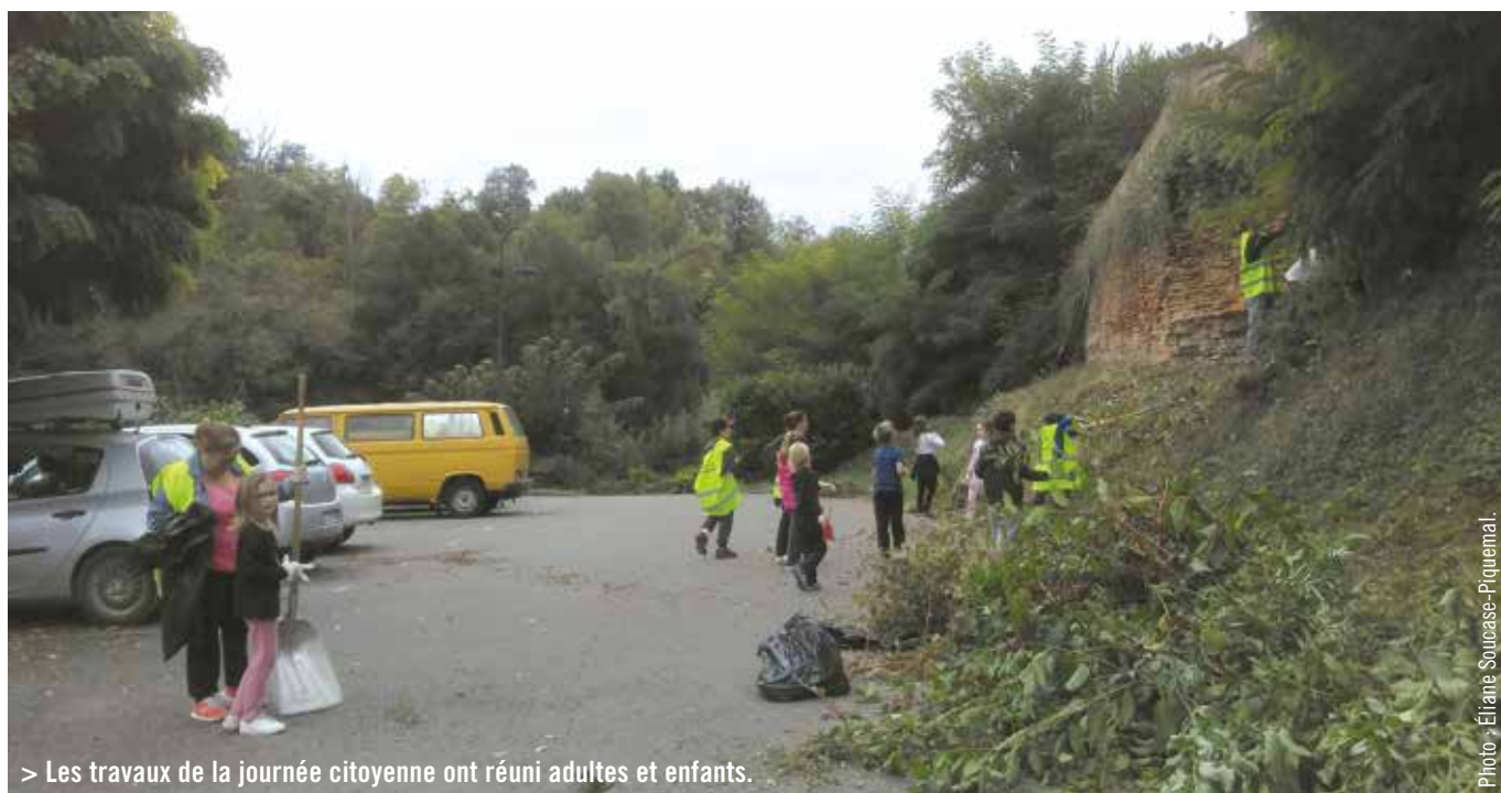
> Les travaux de la journée citoyenne ont réuni adultes et enfants.