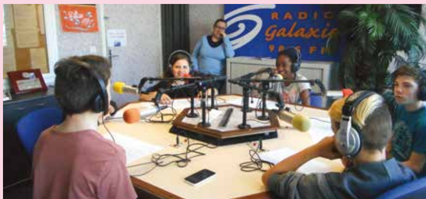
> Atelier radio.

Le foyer des jeunes, c'est notamment l'atelier théâtre du mercredi, un atelier radio avec un passage sur Radio Galaxie 98,5 FM courant novembre, un atelier de danse contemporaine avec la Compagnie Samuel Mathieu dans le cadre du festival NeufNeuf les 5 et 6 novembre, et une restitution en public le vendredi 18 novembre.