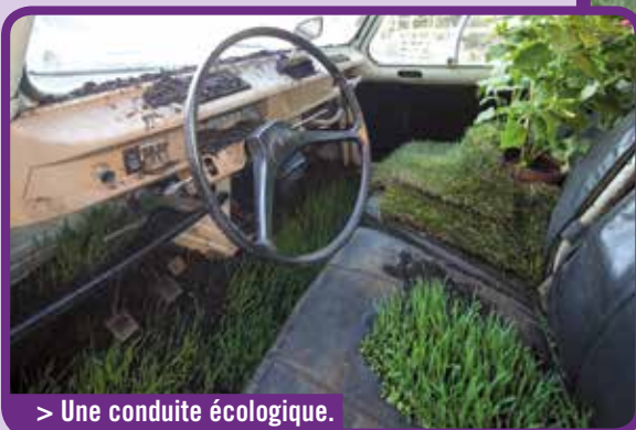
> Une conduite écologique.