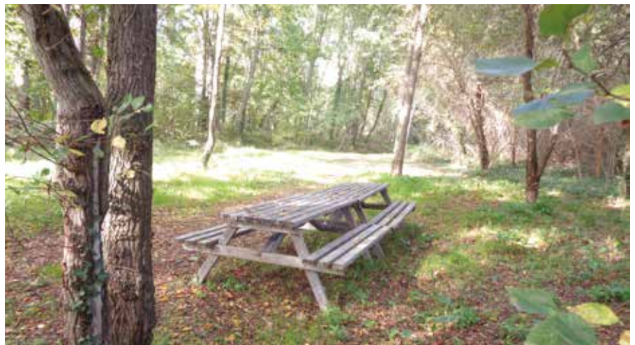
> L'aire de pique-nique proche du Village Gaulois.

de Saint-Julien et au débroussaillage de l'aire de pique-nique proche du Village Gaulois.