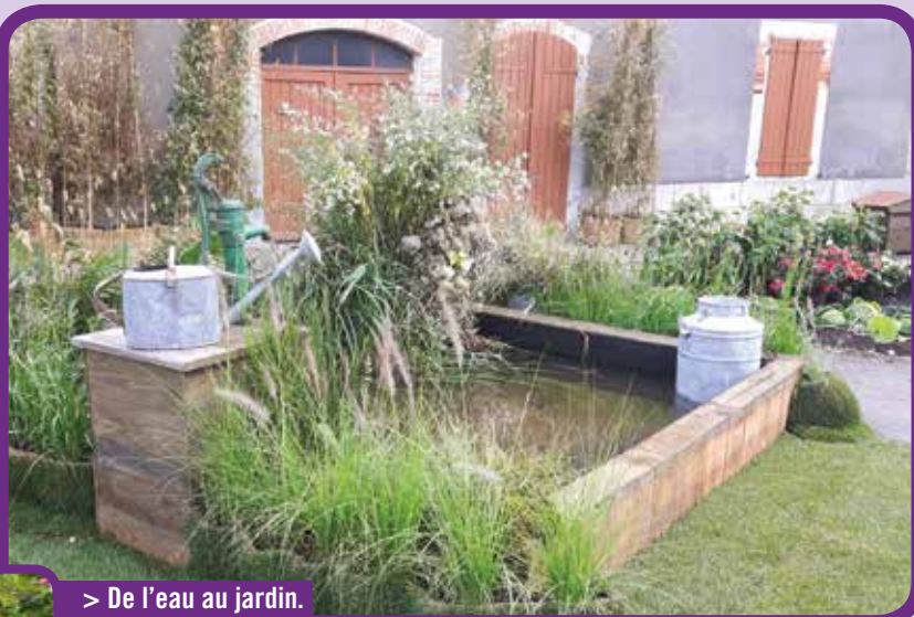
> De l'eau au jardin.