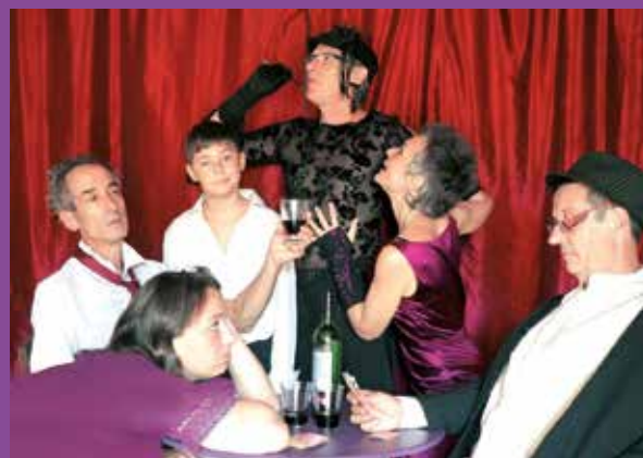
> L'Incorrigeable Volubile.

Réservation : cculture.rioux@gmail.com ou sms : 06 07 56 61 41.