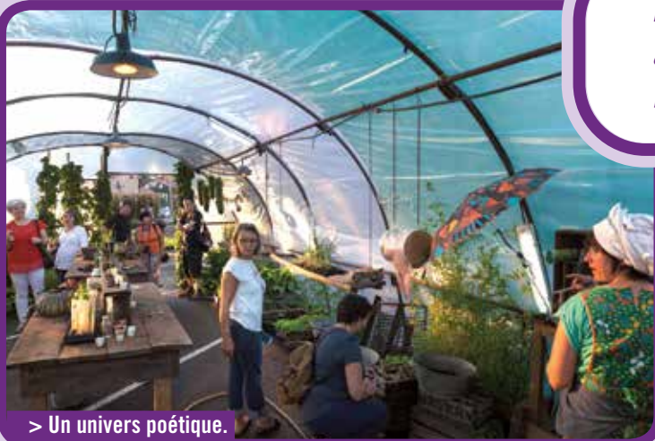
> Un univers poétique.