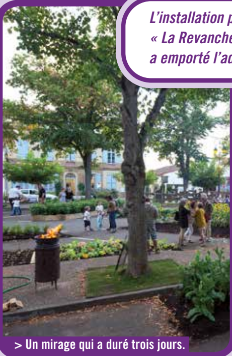
> Un mirage qui a duré trois jours.