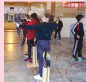
> Découverte du tir à l'arc.

Le foyer des jeunes, c'est notamment l'atelier théâtre du mercredi, un atelier radio avec un passage sur Radio Galaxie 98,5 FM courant novembre, un atelier de danse contemporaine avec la Compagnie Samuel Mathieu dans le cadre du festival NeufNeuf les 5 et 6 novembre, et une restitution en public le vendredi 18 novembre.