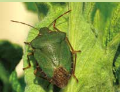
Punaise verte adulte.