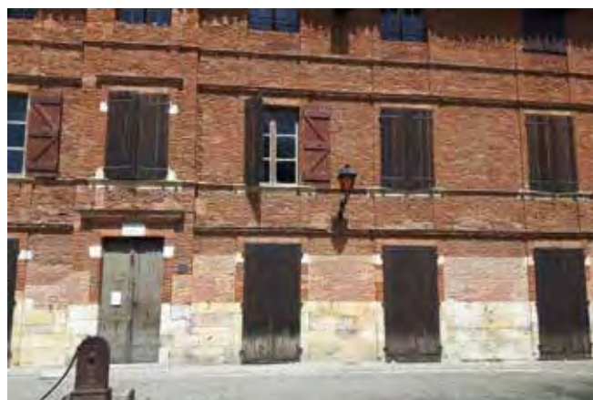
Rénovation d'une pièce mutualisée pour les associations.