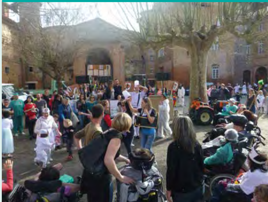
> Carnaval dans la cour du centre Pierre-Hanzel.

Prochain numéro consacré au projet de reconstruction du centre Pierre-Hanzel à Rieux-Volvestre.