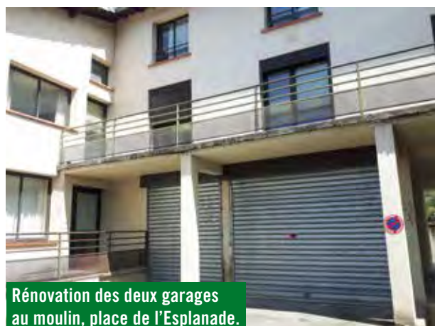
Rénovation des deux garages au moulin, place de l'Esplanade.