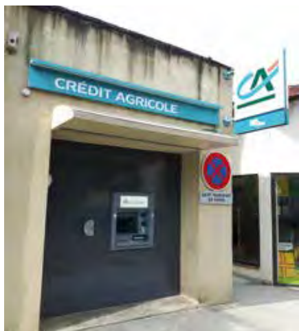
Le Crédit Agricole a modernisé son distributeur.