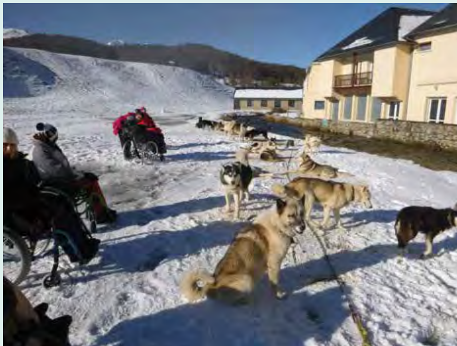
> Sortie neige au lac de Payolle sur les hauteurs de Lannemezan.

Après une belle fin d'année 2017 avec une sortie au lac de Payolle sur les hauteurs de Lannemezan, entre neige et chiens de traîneaux, les thèmes retenus pour l'année 2018 sont variés, « utiles » et porteurs d'une grande convivialité. Au mois de janvier, des futurs aides-soignants de l'IFAS (institut de formation des auxiliaires de soins) de Saint-Gaudens ont été accueillis lors d'une journée musicale à travers la découverte d'instruments de musique originaux. Ces futurs professionnels de santé ont pu ainsi s'immerger au sein d'une maison