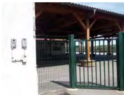
Mise en place d'un appel vidéo à l'école primaire, dans le cadre de la sécurité.