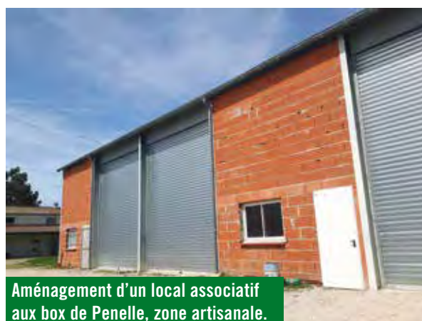
Aménagement d'un local associatif aux box de Penelle, zone artisanale.