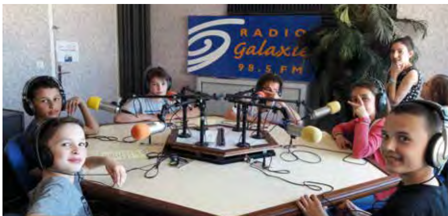
> À Radio Galaxie, les jeunes présentent leurs projets.