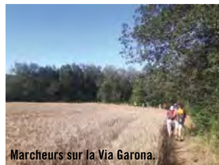
Marcheurs sur la Via Garona.

Depuis le 1 er janvier 2017, l'office de tourisme, devenu intercommunal, exerce ses missions d'accueil, d'information et de promotion sur les 32 communes qui composent le territoire.