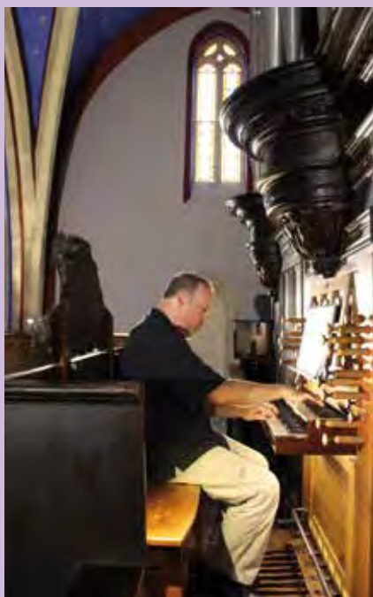
Cathédrale de Rieux-Volvestre, jeudi 12 juillet à 20 h 30. Entrée : 15 €. Tarif étudiant : 10€.