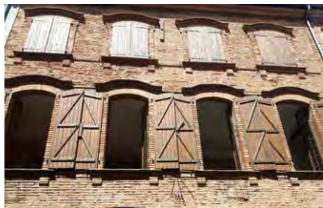
Rénovation de deux appartements à la maison des artisans au 22, rue Saint-Cizi.