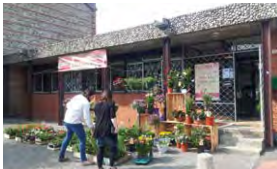
Réhabilitation d'un bâtiment municipal pour ouverture commerce.