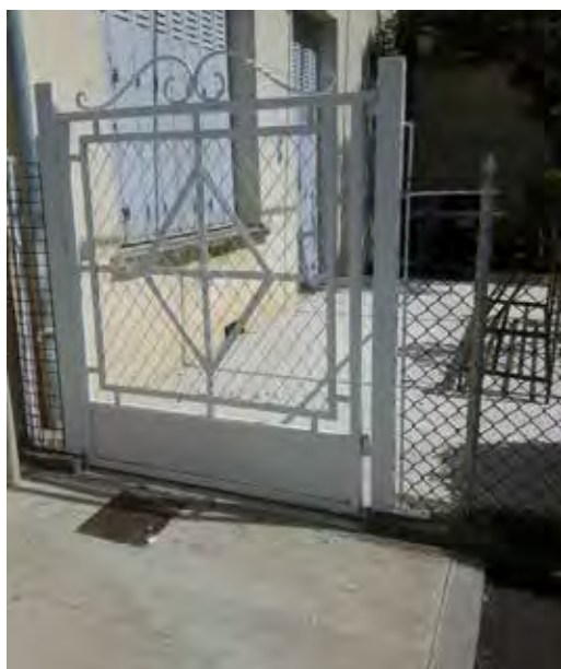
Construction d'une rampe d'accessibilité pour locaux professionnels à la maison Cazarré (entrée côté parking de la poste).