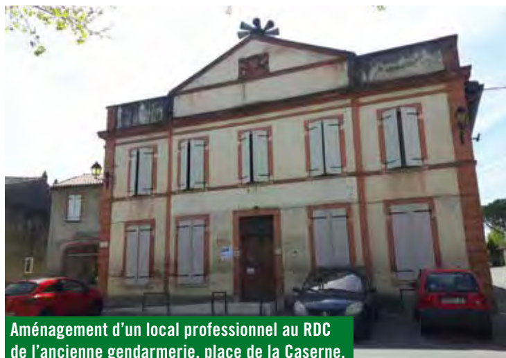
Aménagement d'un local professionnel au RDC de l'ancienne gendarmerie, place de la Caserne.