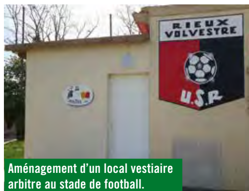
Aménagement d'un local vestiaire arbitre au stade de football.