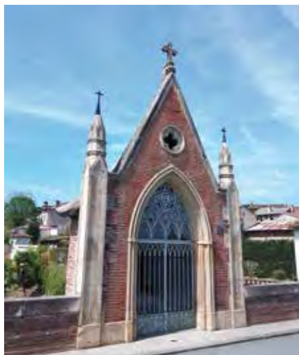
Remise en état de la toiture et des ornements de la chapelle du pont d'Auriac.