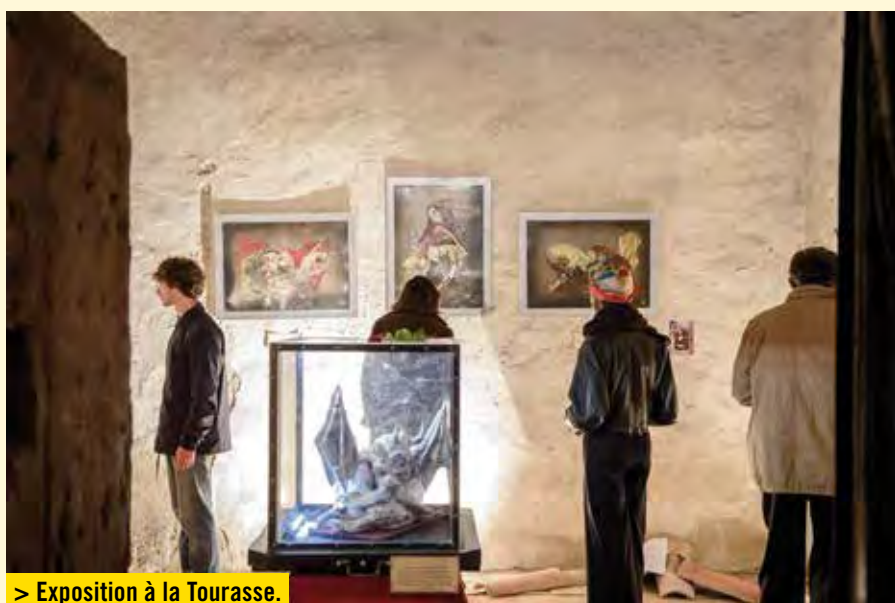
> Exposition à la Tourasse.

Pour en savoir plus ou les contacter : Courriel : linspirationdesmuses@gmail.com Facebook : L'Inspiration Des Muses Instagram : linspirationdesmuses