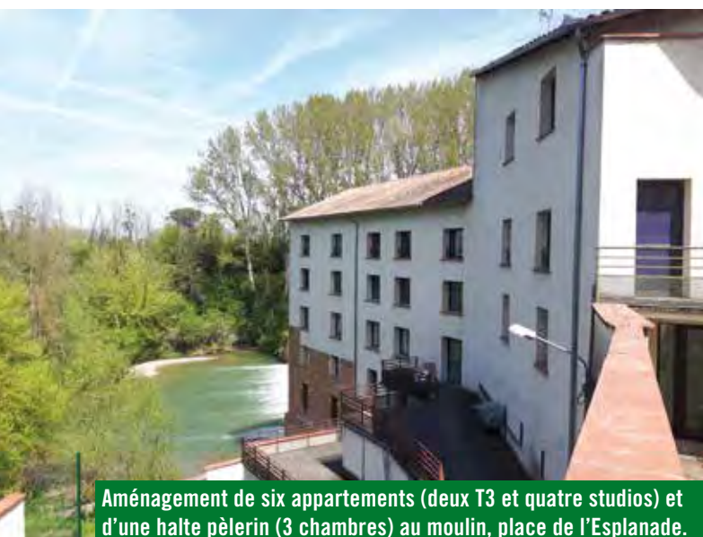
Aménagement de six appartements (deux T3 et quatre studios) et d'une halte pèlerin (3 chambres) au moulin, place de l'Esplanade.