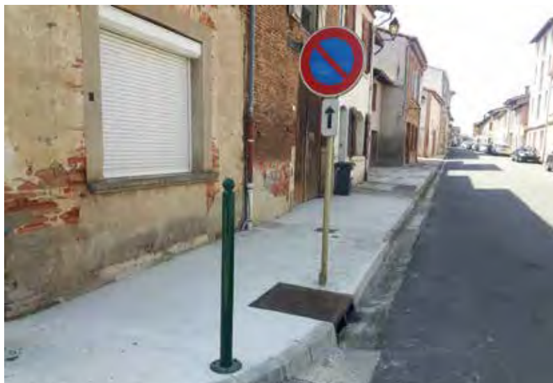
Rénovation trottoir avec accès pour personnes à mobilité réduite.