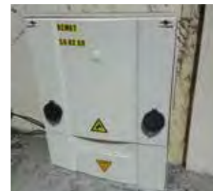
Rénovation de trois coffrets électriques pour manifestations importantes (centre bourg).