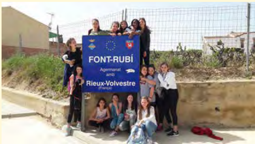
Le groupe des jeunes Rivois à Font-Rubí.

Un accueil très chaleureux et convivial a été réservé à l'ensemble des Rivois. Pour l'an prochain, le même type de rencontre se fera dans notre ville-cité. Les deux comités de jumelage se réuniront courant novembre avec les responsables concernés afin de pré-