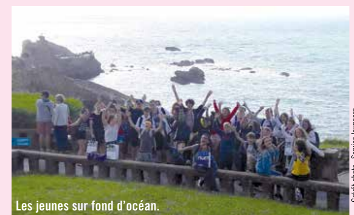
Les jeunes sur fond d'océan.

Tout au long de l'année, les jeunes se sont mobilisés sur des chantiers Ville Vie Vacances, financés par la CAF, afin de réduire le coût de leur séjour. Ces chantiers visent à responsabiliser les jeunes en leur permettant de participer, pendant les vacances scolaires, à des actions innovantes, éducatives et citoyennes.