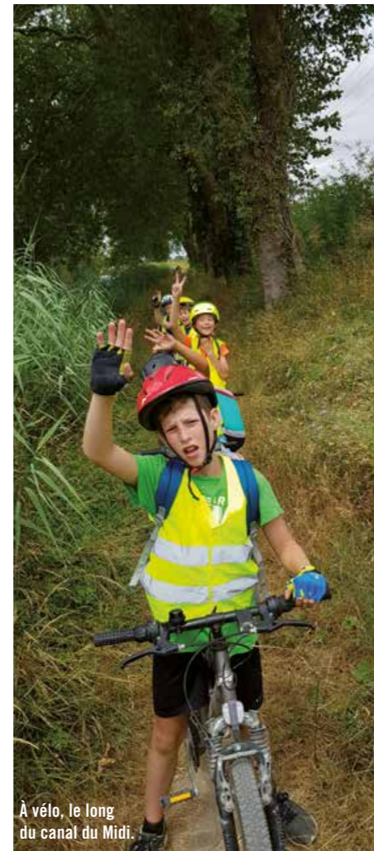
À vélo, le long du canal du Midi.

Mercredi » signés par la collectivité avec la CAF, Jeunesse et Sport et l'Éducation nationale, les propositions de projets menés