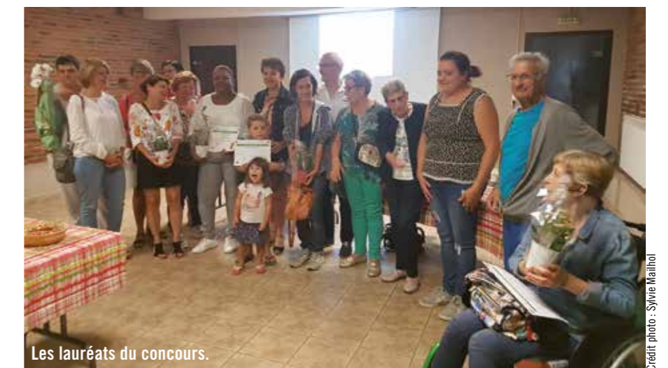
Les lauréats du concours.

Elle a conclu en souhaitant que l'émulation fasse son effet. Que chacun demande à ses voisins de droite... et de gauche de s'engager dans cette démarche !