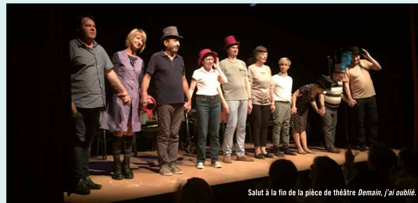
Salut à la fin de la pièce de théâtre Demain, j'ai oublié .

Contact : Halte du Volvestre, 40, chemin de Chantemesse, 31310 Rieux-Volvestre. Tél. : 05 61 90 86 35 Halte.repit@sivom-volvestre.fr https://www.facebook.com/LaHalteDuVolvestre https://www.lemoulin-roques.com/agenda/tout-l-agenda