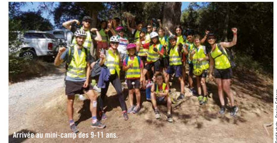
Arrivée au mini-camp des 9-11 ans.