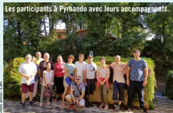
Les participants à Pyrhando avec leurs accompagnants.

Le projet consiste, tous les trois ans, à traverser les Pyrénées de la Méditerranée à l'Atlantique et ainsi valoriser le dépassement de soi, mais aussi la solidarité, la convivialité et le partage. En 2019, l'ESAT foyer SAMSAH Le Ruisselet a participé de nouveau à cette belle aventure après avoir suivi une préparation physique depuis plusieurs mois.