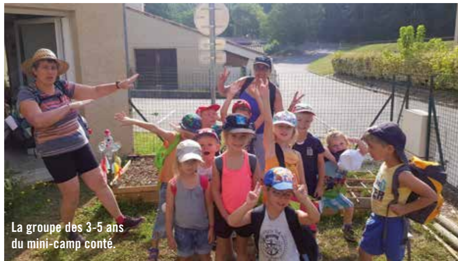
La groupe des 3-5 ans du mini-camp conté.

Les petits aventuriers de Tom Pouce ont pu voyager de planète en planète pour acquérir les compétences « d'Ambassadeur d'une terre propre » afin d'imaginer et de bâtir leur planète idéale sur l'été. La construction d'un village témoin était pour les 140 enfants accueillis au cœur du projet : constructions à partir de recyclage, réalisation d'un jardin potager et d'un jardin d'herbes aromatiques... En parallèle et en complémentarité du projet, trois mini-camps ont pu être proposés : un « voyage conté » autour de la nature avec une nuit sous la tente pour les plus petits, la découverte de nouvelles activités autour de la nature