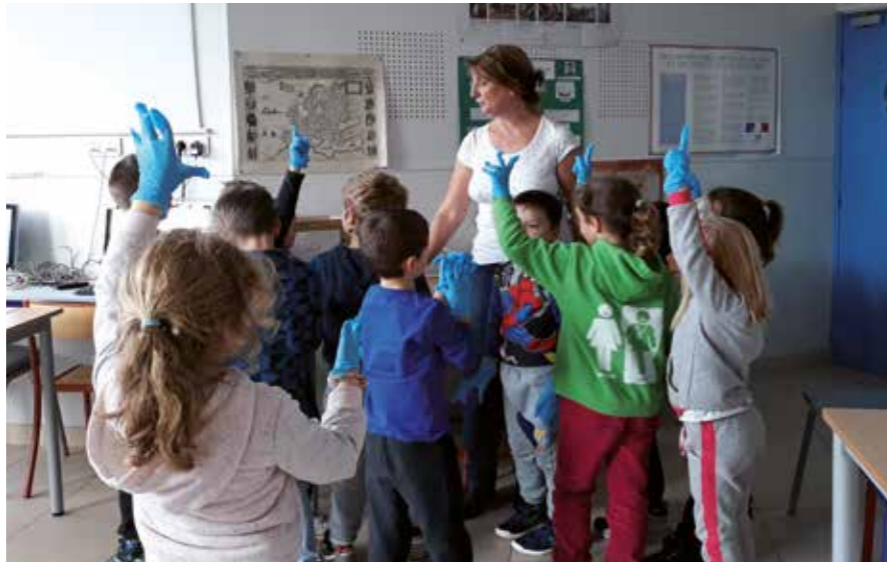
L'ambassadrice du tri avec les enfants de l'école.

Nous tenons d'ailleurs à remercier vivement les enseignants pour leur réactivité et leur implication dans ce projet.