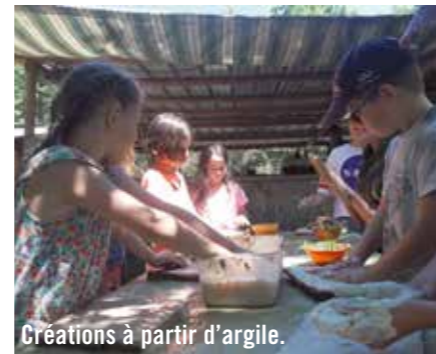
Créations à partir d'argile.

Dans le cadre du PEDT (Projet éducatif de territoire) et du « Plan