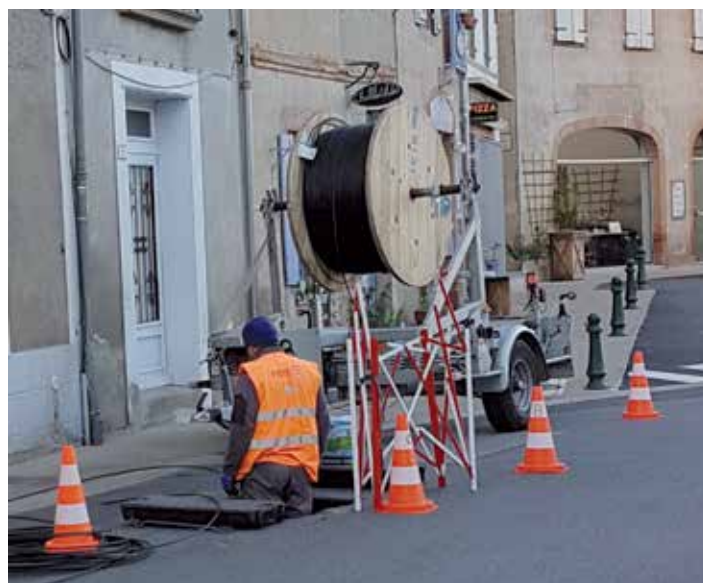
Travaux d'installation de la fibre optique.

Cependant, si le problème provient d'un dysfonctionnement dû à votre opérateur, prenez contact directement avec lui, car Fibre 31 ne peut intervenir dans ce cas précis.