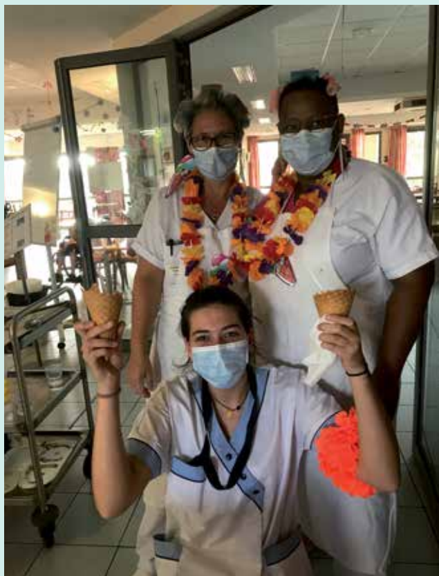
Soignants ou résidents...