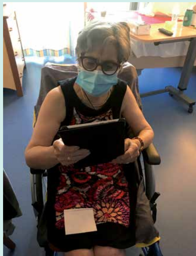
On reste en contact avec ses proches

La crise sanitaire, comme vous le savez, n'est pas derrière nous et nous devons faire face en ce moment même à des cas positifs, aussi bien parmi les résidents que le personnel. Toute notre énergie est concentrée à la protection des personnes dont nous prenons soin au quotidien et nous espérons collectivement surmonter cette période difficile et retrouver au plus vite une vie et un fonctionnement normal, au service de nos aînés. »