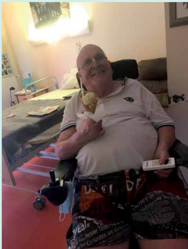
...on apprécie les glaces de l'été.