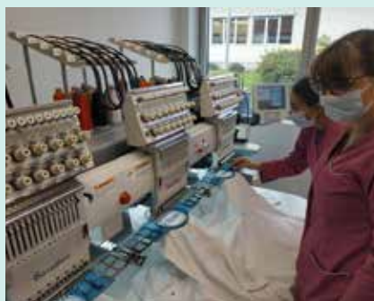
Travail sur la brodeuse industrielle.

Une vaste opération de travaux a débuté en septembre 2020, et devrait prendre fin en juillet 2021. Les travaux permettront de rénover le foyer d'hébergement et la menuiserie, de réaliser une extension de la blanchisserie et de créer une zone de stockage. Douze entreprises extérieures interviennent sur le chantier, ainsi que l'atelier maçonnerie de l'établissement.