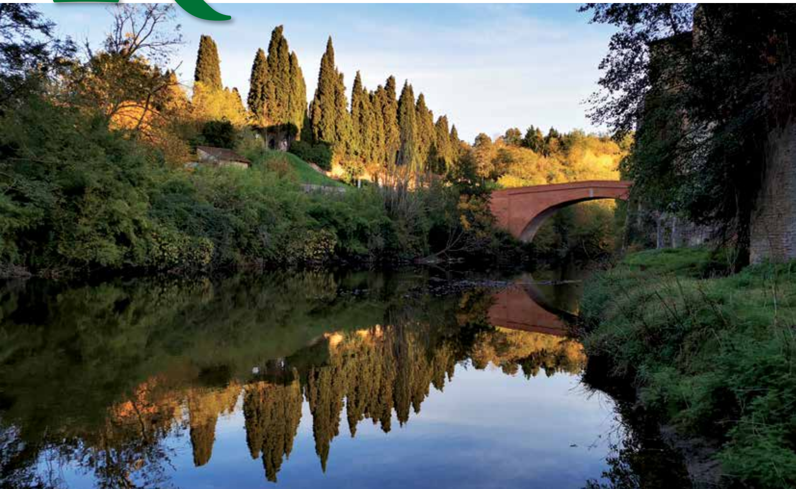
Le pont Lajous depuis la rive gauche de l'Arize.

CHEMINS DE SAINT-JACQUES- DE-COMPOSTELLE