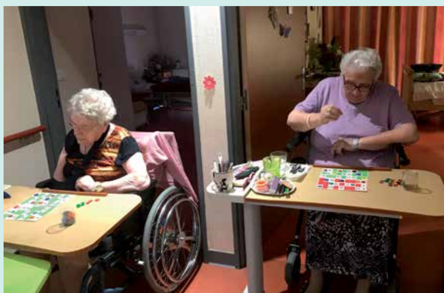
C'est du sérieux, on joue...

La crise sanitaire, comme vous le savez, n'est pas derrière nous et nous devons faire face en ce moment même à des cas positifs, aussi bien parmi les résidents que le personnel. Toute notre énergie est concentrée à la protection des personnes dont nous prenons soin au quotidien et nous espérons collectivement surmonter cette période difficile et retrouver au plus vite une vie et un fonctionnement normal, au service de nos aînés. »